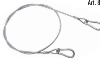
Art. 80 Cavo di sicurezza Safety cable

Il cavo di sicurezza è fortemente raccomandato unitamente all'utilizzo di ogni tipo di morsetto e gancio di tiro