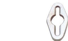
Art. 93 Accorcia catena Chain shortner