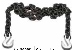
Art. 3002S Catene di tiro Pull chains