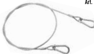
Art. 80 Cavo di sicurezza Safety cable

Il cavo di sicurezza è fortemente raccomandato unitamente all'utilizzo di ogni tipo di morsetto e gancio di tiro