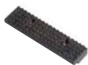
Ganasce dentate intercambiabili Interchangeable jaws