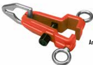
Art. 140 Pinza Pull clamp