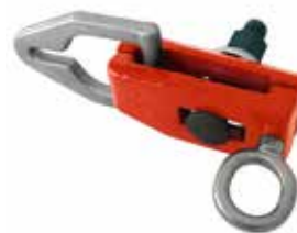
Art. 145 Morsetto piatto Flat clamp