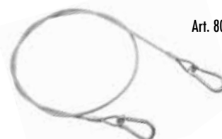
Art. 80 | Cavo di sicurezza Safety cable

Il cavo di sicurezza è fortemente raccomandato unitamente all'utilizzo di ogni tipo di morsetto e gancio di tiro. The use of the safety cable is strongly recommended together with all pull clamps and hooks.