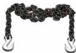
Art. 3002S | Catene di tiro Pull chains