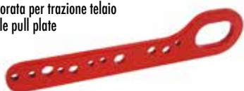
Art. 123 | Piastra forata per trazione telaio Multi hole pull plate