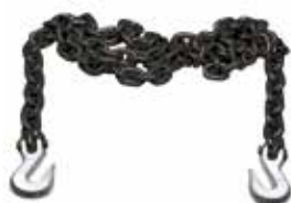
Art. 30025 | Catene di tiro Pull chains