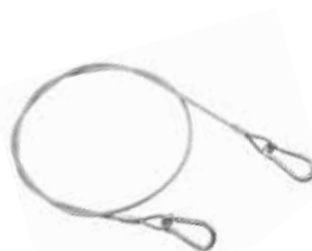
Art. 80 | Cavo di sicurezza Safety cable

Il cavo di sicurezza è fortemente raccomandato unitamente all'utilizzo di ogni tipo di morsetto e gancio di tiro.