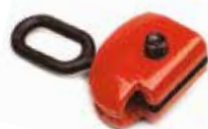
Art. 135 | Morsetto pluridirezionale Swivel clamp