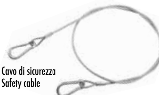
Art. 80 | Cavo di sicurezza Safety cable

Il cavo di sicurezza è fortemente raccomandato unitamente all'utilizzo di ogni tipo di morsetto e gancio di tiro. The use of the safety cable is strongly recommended together with all pull clamps and hooks.