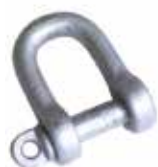
Art. 904 | Grillino Shackle