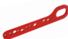
Art. 123 | Piastra forata per trazione telaio Multi hole pull plate