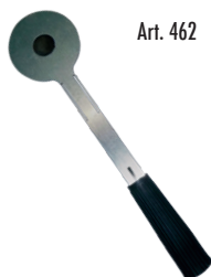
Art. 462 | Supporto magnetico Magnetic support