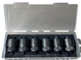
Art. 460 | Punzoni per foratura paraurti per l'applicazione dei sensori di parcheggio Bumper drilling punches can be apply any type of parking sensor