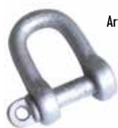
Art. 904 | Grillino Shackle