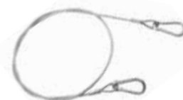
Art. 80 | Cavo di sicurezza Safety cable

Il cavo di sicurezza è fortemente raccomandato unitamente all'utilizzo di ogni tipo di morsetto e gancio di tiro. The use of the safety cable is strongly recommended together with all pull clamps and hooks.