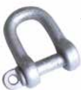
Art. 904 | Grillino Shackle